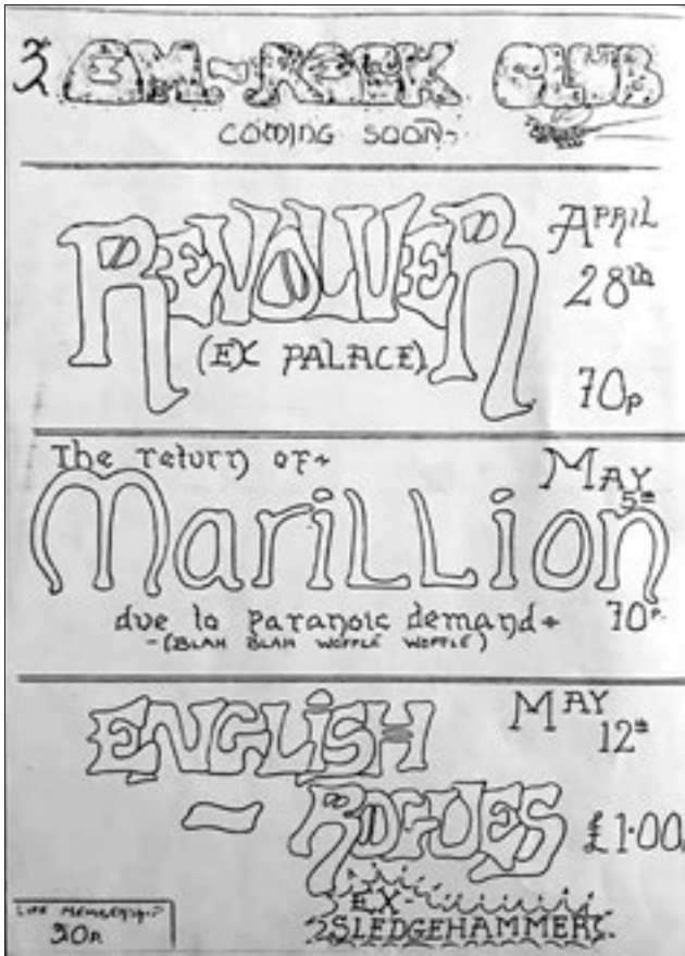
Volantino del concerto al Britannia di Aylesbury del maggio 1981.

mi paralizzava», ricorda il cantante. «Mi trovavo a cantare canzoni con i miei testi. Non avevo mai fatto un concerto in pubblico con questa band. Così ho deciso di truccarmi il volto. Era una maschera: quando salivo sul palco ed ero truccato, mi sentivo protetto. Se avessi fatto schifo mi sarei potuto togliere la maschera e andare a nascondermi. Divenne parte integrante delle cose ed ero consapevole che quello che stavamo facendo in questi pub lo facevamo soltanto noi».