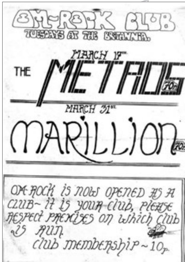
Volantino del concerto al Britannia del marzo 1981.

Dopo circa tre mesi di prove, il gruppo è pronto per il suo debutto dal vivo. Il concerto è fissato per il 14 marzo del 1981 al Red Lion Pub di Bicester. Viene proposto un set di sei canzoni che ancora risente dell'eredità del "periodo Irvine": 'Grendel', 'Snow Angel', 'Herne the Hunter', 'The Web', 'Skyline Drifter' e 'Garden Party'. Il pubblico è ancora ridotto, supera di poco la sessantina di persone e nemmeno troppo ben disposte. Ma Fish riesce ad affrontare anche un'atmosfera