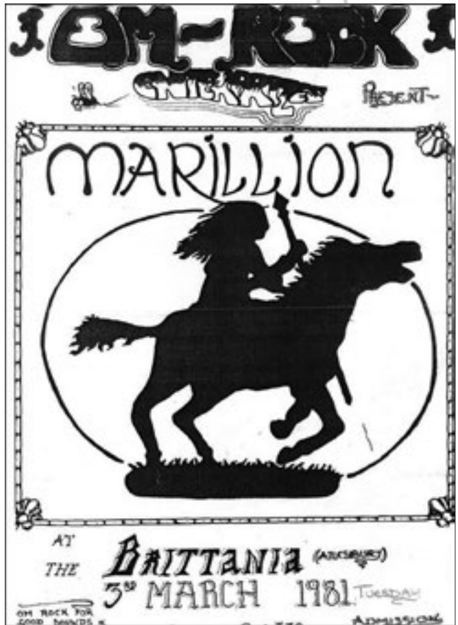
Volantino dello show al Britannia del marzo 1981.

Con la nuova line-up formata, i Marillion si mettono sotto con il lavoro. Le prove si susseguono tra i Leyland Hill Farm Studios e la Anthony Hall; il repertorio si va irrobustendo, si mette mano alle vecchie composizioni – che, con l'aggiunta di testi e linee vocali, cambiano pelle – e se ne aggiungono di nuove. Iniziano a emergere gli embrioni di pezzi